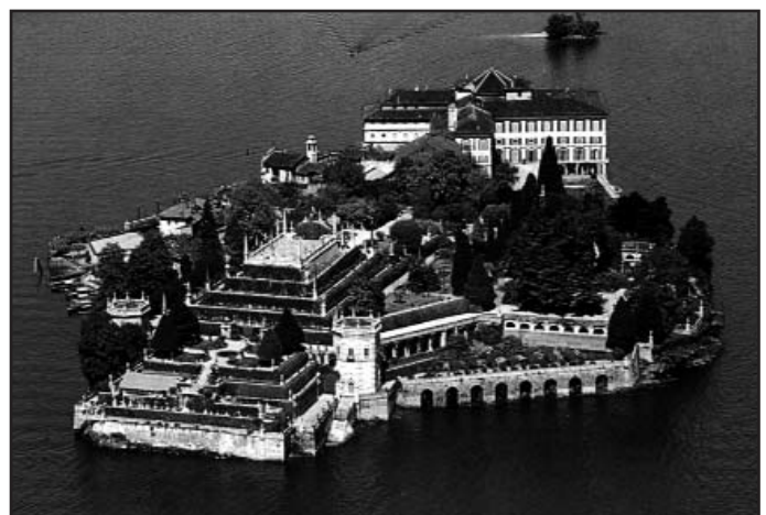
Foto: Isola Belle im Lago Maggiore